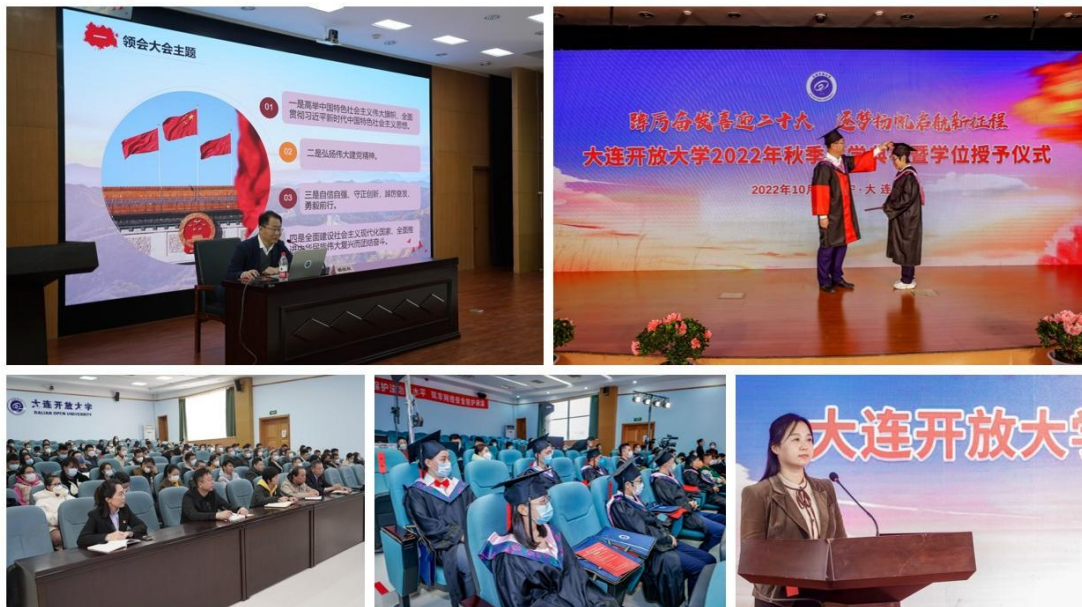
(开展思想政治理论课及课外教育活动)