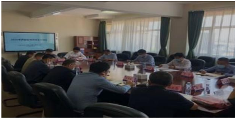
学校举行开放教育系统工作会议

学校积极建立完善教学质量监控体系，制定了教学检查、教学质量督导等办法草案，以规范教学质量管理工作。加强质量管理体系建设，各办学单位设置专人负责教学质量管理工作。进一步完善教学质量监控方式，对各办学单位教学进行全方位监控，开展督导检查。落实校领导联系分校制度，定期召开系统工作会议，实现业务精准对接。学校严格按照《关于学历教育创优提质战略的实施意见》文件要求，认真落实国开推动质量发展“一路一网一平台”“三教”“三精”策略，严格治理“三乱”，效果明显，招生、教学、考试等工作总体有序开展。